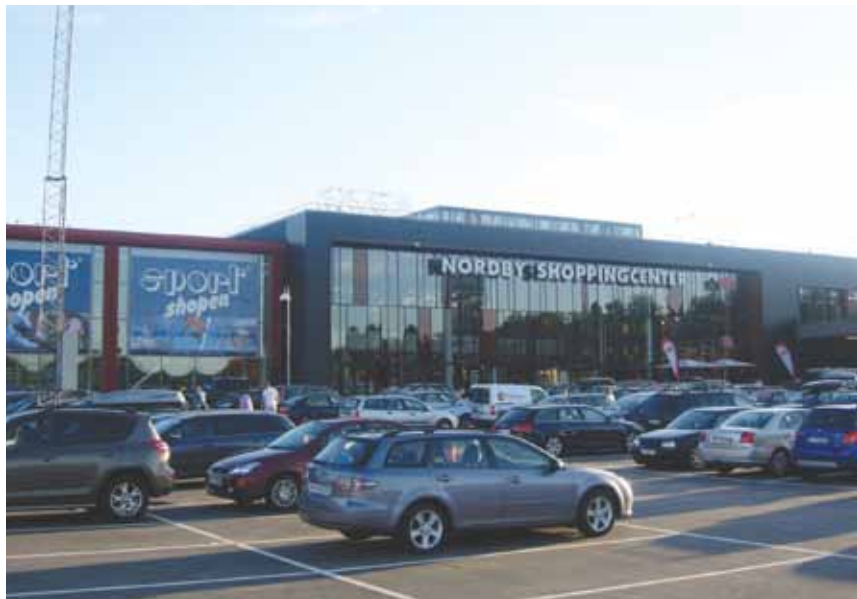
Figur 2. Gränshandelns materialiserade utfall i Strömstad kommun.

Gränshandelns ökning har inte bara medfört att fler norrmän reser över gränsen för