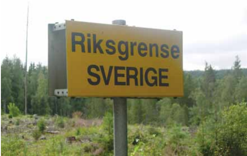
Figur 1. Riksgränsen mellan Norge och Sverige slingrar sig fram i glesbefolkade skogs- och fjällområden och är en mycket öppen gräns som tillåter passage av såväl varor som människor i stor mängd.

sysselsättningstillfällen försvann på den norska sidan av riksgränsen. I takt med att löner och priser stigit i Norge har också arbetspendlande svenskar i Norge blivit allt vanligare (Bore 2005, Berger et al 2007).