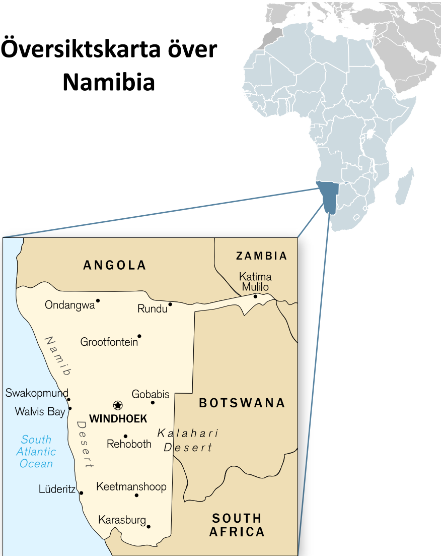
Figur 1. Översiktskarta för Namibia. (BS 2011, Internet; WP 2011, Internet). Här ses att staden Rundu ligger i direkt anslutning till Angola.