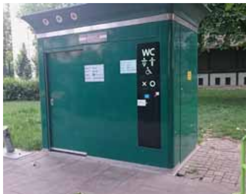
Bild 2. Offentlig toalett vid Markusovszky tér i Distrikt IX.

informerar i någon av dessa typologier, utan både personer utan tak och i olika former av, vagt definierade, 'undermåliga' boendeförhållanden, har setts genom linsen 'socialt utanförskap'.