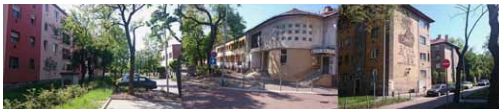
Bild 8. Grannskapet vid Pongrácz utca.

Vid Pongrácz utca, i ett område några kvarter bort i samma distrikt, och som härstammar från samma tidsperiod, är situationen annorlunda. Standarden var högre från början, med inbyggda badrum och kranvatten. Sedan 2009 har EU delfinansierat ett renoveringsprojekt av distrikt-sägda lägenheter, och alla fasader (se bild 8; forskare 3; forskare 4). Vi noterar att området överlag är bättre underhållet än det vid Hős utca. Där bedrivs viss informell handel med livsmedel på grund av dess isolerade läge (forskare 4), men här finns ett utbud av kommersiell och offentlig service, och kommunikationerna är betydligt bättre.