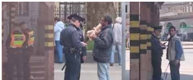
Bild 3. Poliserna som pratar med män i Budapest.