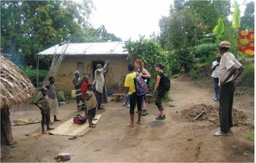
Figur 4. Besök hos ett hushåll. Foto: Staffan Rosell 2014.

denna modell har grupperna själva fått formulera vad mer exakt de vill studera, de frågeställningar de tänker sig, och med vilka metoder de vill ta sig an uppgiften. Kursledarna har diskuterat med gruppdeltagarna hur de vill lägga upp sin uppgift och hur de kan gå tillväga för att ta reda på information om det problemområde som intresserar dem.