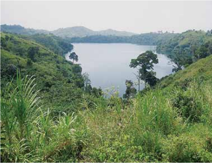
Figur 2. Kratersjö SO om Fort Portal.

har inkluderat ett team som skött boende och mathållning åt gruppen, samt ett antal fältguider som också agerat tolkar åt studenterna. Under ankomstdagen har kursledarna hållit en introduktion till uppgiften som studenterna ska genomföra under vistelsen på landsbygden, samt gjort en kortare genomgång av GPS:er och andra enk-