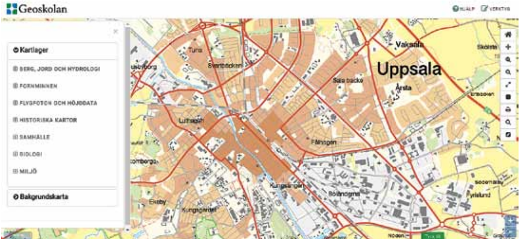
Bild 2. Geoskolans kartapplikation med kartlager från olika myndigheter – visualiserar geodata i ett enkelt GIS (geografiskt informationssystem).

våra geodata ska vara tillgängliga, lätta att förstå och använda. Geoskolan är en naturlig del av vår verksamhet; att öka och bredda kunskapen om och användningen av geodata.