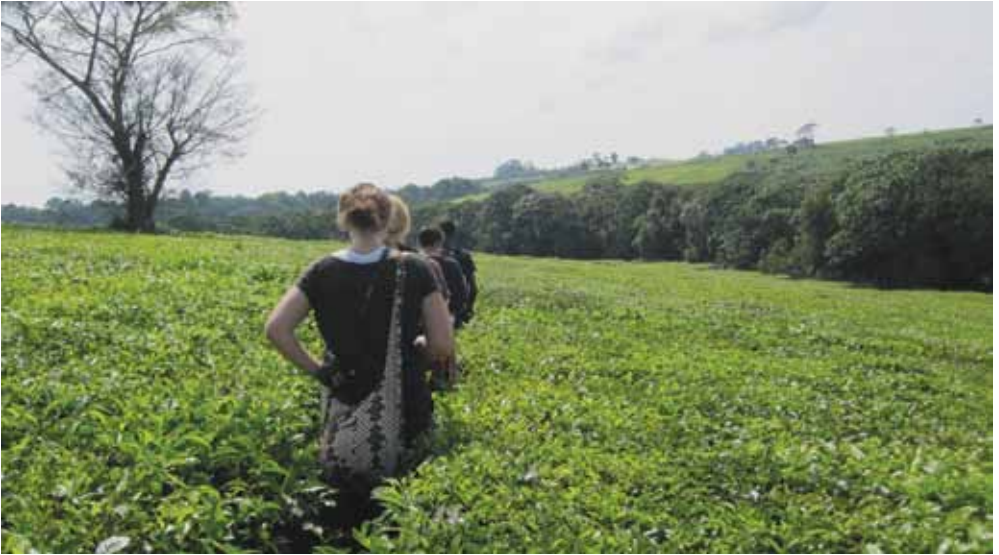
Figur 1. Vandring genom teodling öster om Fort Portal.

på en tefabrik har ingått, där studenterna fått följa hela produktionslinjen från de nyligen plockade tebladen till det förpackade svarta teet.